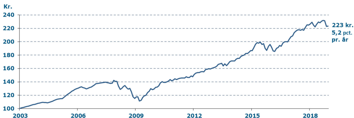
Figur 1. For en 45-årig er 100 kr. fra 2003 - 2018 vokset til

Af figur 1 fremgår udviklingen i 100 kr. forrentet med depotrenten for en 45-årig i Pensionspakken siden 1. januar 2003. 100 kr. indbetalt i 2003 er således vokset til 223 kr. ved udgangen af 2018. Af figuren fremgår, at tabet under den finansielle krise i 2008-2009 er indhentet. Medlemmerne har over perioden fået en depotrente, der langt overstiger inflationen. På en markedsrenteordning må det forventes, at der fra tid til anden vil være år med negative depotrenter, men bestyrelsen er af den opfattelse, at over længere perioder vil depotrenten på en markedsrenteordning være højere end på en garanteret grundlagsrente på gennemsnitsrente.